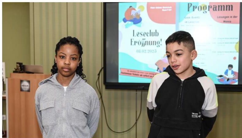
Feres und Olo sind im Leseclub engagiert.

Kein Räuspern, kein Knistern, kein Gemurmel – mucksmäuschenstill ist es im gemütlich eingerichteten Leseclub an der Peter-Ustinov-Realschule, als Leonidas aus „Gregs Tagebuch, Band 19“ vorliest. Doch als der 11-jährige Schüler und Gewinner des schulinternen Vorlesewettbewerbs an die Stelle kommt, an der Gregs Oma auf die Frage nach dem streng gehüteten Rezept ihrer köstlichen Fleischbällchen antwortet: „Sie bestehen aus nur einer Zutat: Liebe“, durchbricht Beifall die Stille im prominent besetzten Leseraum.